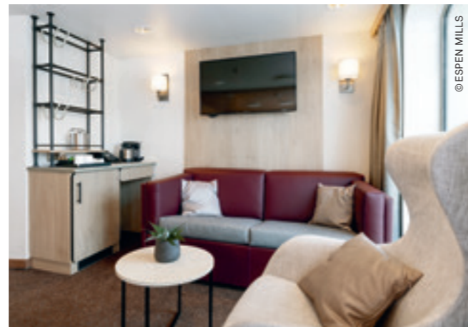
EXPEDITION Suite (Suite)